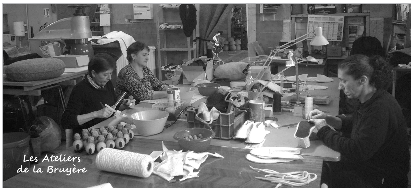
Les Ateliers de la Bruyère

de la gouvernance en garantissant une gouvernance collective et en réservant la présidence à un acteur économique privé.